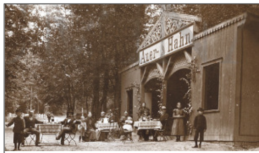
Restauracja leśna Auerhahn, 1901 r.