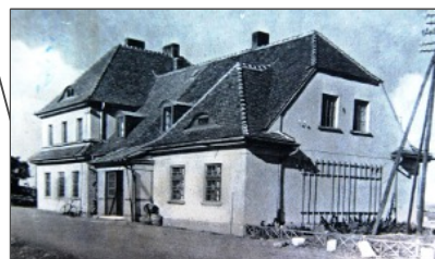
Budynek dworca istniejący w latach 1916-1945.