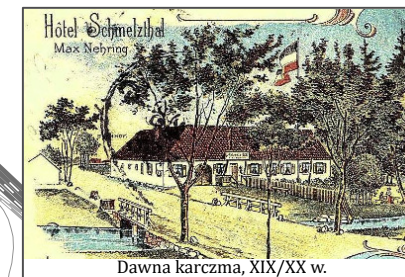
Dawna karczma, XIX/XX w.