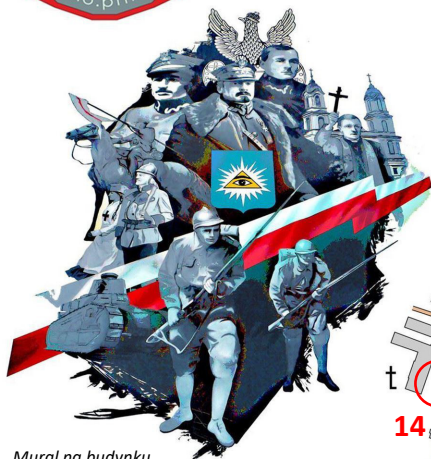
Mural na budynku przy skwerze św. Floriana w Radzyminie